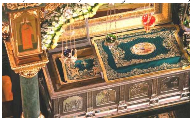
Рака с мощами прп. Серафима Саровского в Дивеевском монастыре

От чтения Священного Писания бывает просвещение в разуме, который оттого изменяется изменением Божиим. Очень полезно заниматься чтением слова Божия в единении и прочитывать всю Библию разумно. За одно такое упражнение, кроме других добрых дел, Господь не оставляет человека Своею милостью, но исполнит его дара разума.