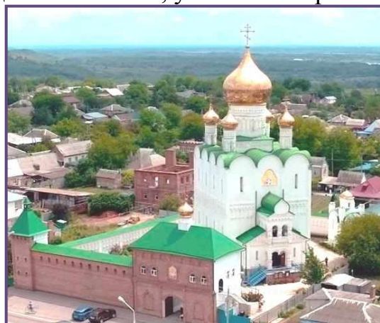
Свято-Никольский храм, ст. Кавказская

Электронную версию «Троицкого листка» можно найти на сайте нашего храма: http://kazankahram.cerkov.ru и на сайте Кавказского благочиния: http://kavkaz.blagochin.ru